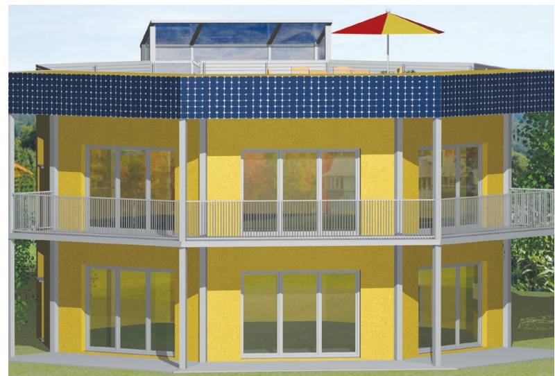
Das Haus der Zukunft lädt ab 12. Mai zum Probewohnen ein.

Modern Bauen Bau GmbH MB HAUS Ein Partnerunternehmen der Alfred Trepka GmbH