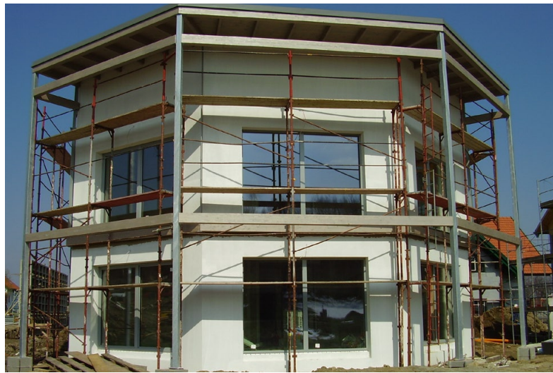
Außenansicht und Grundriss des MB-Haus Muster-Passivhauses am Sonnenplatz in Großschönau.

Besonderheiten: Photovoltaikanlage auf dem Dach; Dachterrasse mit herrlichem Rundblick über die gesamte Anlage; außen liegender Stiegenaufgang für störungsfreien Betrieb beider Wohneinheiten.